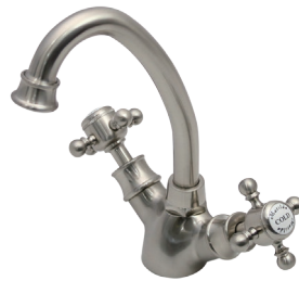
MA006C14L Matilda 洗面用混合栓 アメイジア・ラバトリー