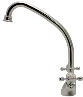
MA006C14K Matilda キッチン用混合栓 アメイジア・キッチン