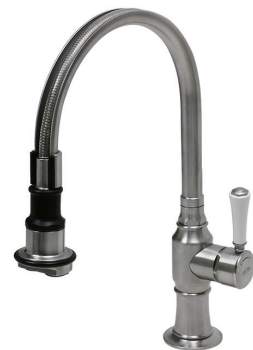
1272UK-WC52 シングルレバーミキサー (シャワースプレー)