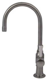
1073UK-WC52 シングルレバーミキサー (ショート)