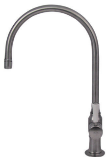
1271UK-WC52 シングルレバーミキサー (ミドル)