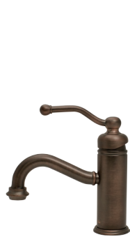
MACVF02 Matilda シングルレバー混合栓 ベルフリー・クラシック