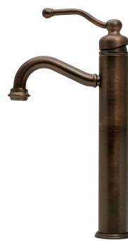
MACVF01 Matilda シングルレバー混合栓 ベルタワー・クラシック