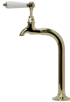
MA902L1 Matilda 手洗用単水栓 フィッシャーマン