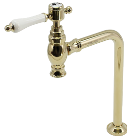
MA19JL Matilda 手洗い用単水栓 クリオネ・エспа