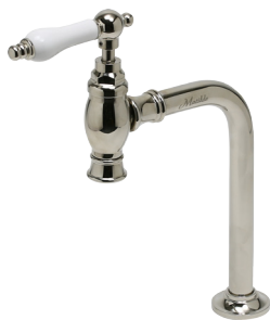
MA904L1 Matilda 手洗い用単水栓 クリオネ・ペティート