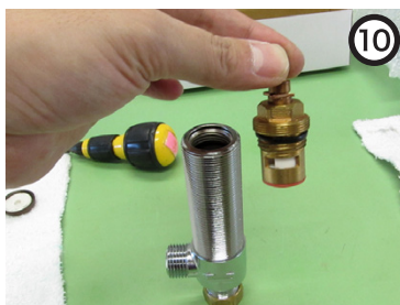
バルブが外れる。本体・バルブにゴミが噛んでいないか確認。