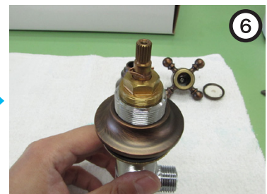
エスカッションリングを外す。 ※手回しで外れる。