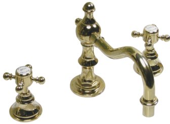
MA423C8 Matilda 洗面用 8 インチ混合栓 スパニッシュ・キャッスル CC