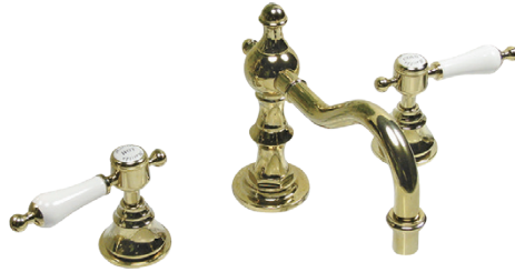
MA422L8 Matilda 洗面用 8 インチ混合栓 スパニッシュ・キャッスル CL