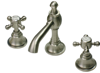
MA999C8 Matilda 洗面用 8 インチ混合栓 ニコラ CC