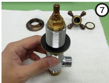
パッキン・ナットを外す。