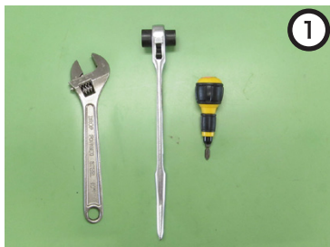
使用する工具 ・モンキーレンチ (ラチェット) ・プラスドライバー