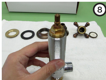
外観の装飾品を全て取り外す。 ※洗面器などに直付けた状態での取り外しは不可。