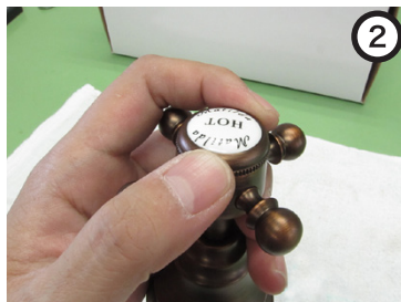
サインキャップを回して、ポイントを外す。※手回しで外れる。