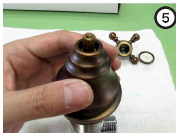
エスカッションを外す。 ※手回しで外れる。