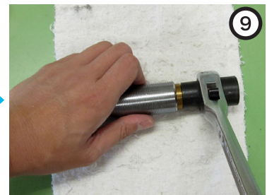
工具 (レンチ・ラチェットなど) を使用してバルブを緩める。